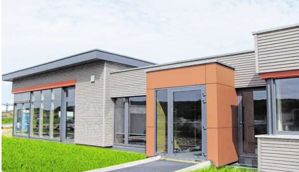
Das neue Fitnessstudio befindet sich Am Gamberg 8 in Assamstadt.

am 5. Mai 2018 von 13 bis 18 Uhr und 6. Mai 2018 von 10 bis 18 Uhr Am Gamberg 8 in Assamstadt