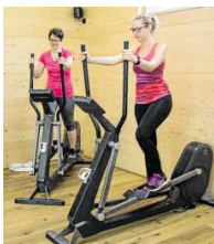
An den Geräten werden alle Hauptmuskulgruppen trainiert.