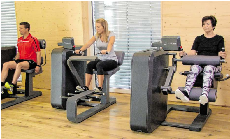
Das Training ist für jede Altersstufe und jedes Trainingsniveau geeignet.