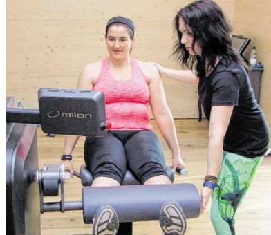
Der Milon Zirkel ermöglicht effektives Training.